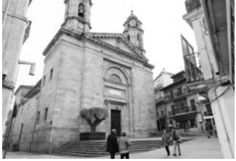
A Praza da Pedra e Colexiata de Santa María