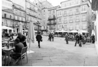
C Praza da Constitución