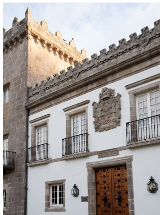
ABAJO Pazo Quiñones de León

cara a América; o MONUMENTO AO FERREIRO , de Guillermo Steinbrüggen, na praza de Eugenio Fadrique, que amosa a importancia do sector metalúrxico na industria naval; ou O RAPTO DE EUROPA , de Juan Oliveira, na avenida de Samil, que nos leva á praia máis popular de Galicia, un lugar ideal para gozar ao aire libre da propia praia, os frondosos piñeirais circundantes ou as terrazas coas mellores vistas.