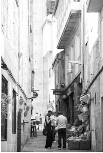
B Rúa dos Cesteiros