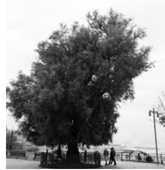
D Mirador do Olivo