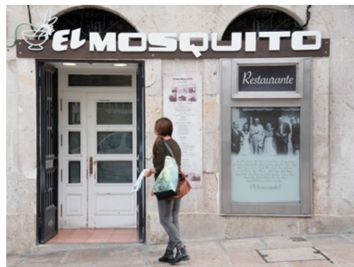
ABAIXO Restaurante El Mosquito PÁXINA OPOSTA, ARRIBA Alimentación Rivera

Sobre dous templos anteriores xa desaparecidos, construíuse en 1811 a actual COLEXIATA DE SANTA MARÍA , que hoxe ostenta rango de concatedral. É un sobrio e ben proporcionado edificio, deseñado polo arquitecto Melchor de Prado y Mariño, que custodia no seu interior unha das imaxes máis veneradas de Galicia, o Santo Cristo da Vitoria, patrón da cidade, que sae en procesión o primeiro domingo de agosto acompañado por decenas de miles de fieis; de feito, é a procesión máis multitudinaria de Galicia. O 28 de marzo de 1809 as tropas napoleónicas foron derrotadas e expulsadas de Vigo mediante a intercepción do Santo Cristo, por iso se celebra nesta data o Día da Reconquista e tódolos anos se recrea o episodio no barrio do Berbés. Outro acontecemento histórico que marcou o devir de Vigo foi o desembarco do corsario Drake, a finais do século XVI, que arrasou O Berbés