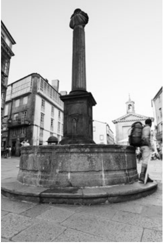
A Praza de Cervantes