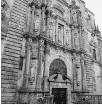
B San Martiño Pinario