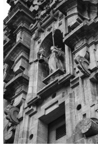
D Convento das Clarisas