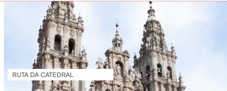
RUTA DA CATEDRAL