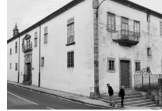
E Hospitalillo de San Roque