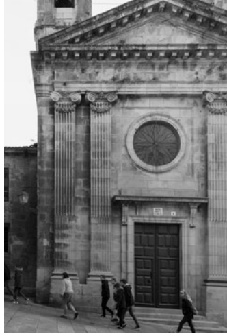
C San Miguel dos Agros