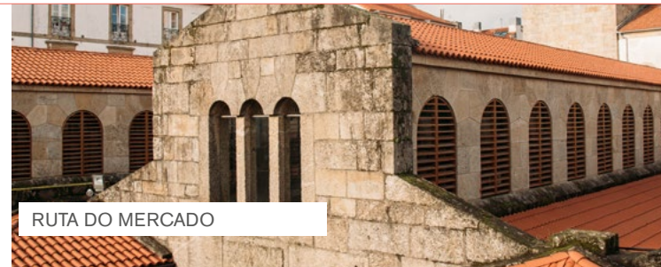
RUTA DO MERCADO