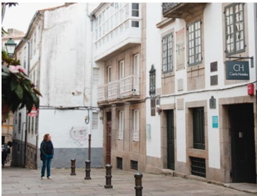
ARRIBA Antigüedades Folgar ABAIXO Casa da Troia

No nº 8 da rúa da Troia a tenda Acivro Xoias ofrécenos orixinais e elegantes pezas maioritariamente de prata, xuntando a tradición