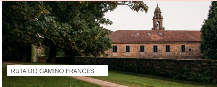
RUTA DO CAMIÑO FRANCÉS