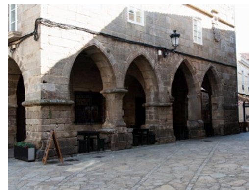
ARRIBA Armería Romani ABAIXO a Tasca Típica PÁXINA OPOSTA Droguería Luma