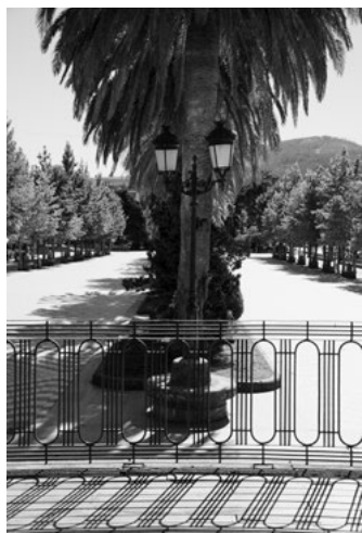
Igrexa de Santa María a Nova