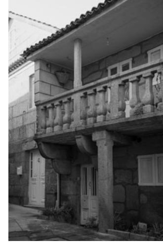
E Casas mariñeiras (rúa do Mar)