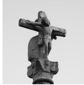
C Cruceiro da igrexa de San Roque