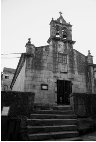
B Igrexa de San Roque