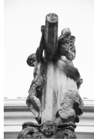
D Cruceiro da Rúa