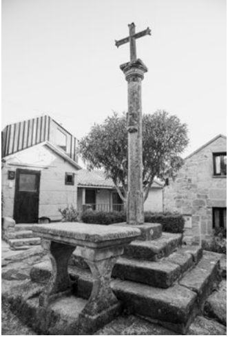
A Cruceiro da praça de San Roque