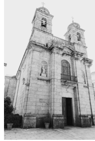
E Santuário dos Remedios