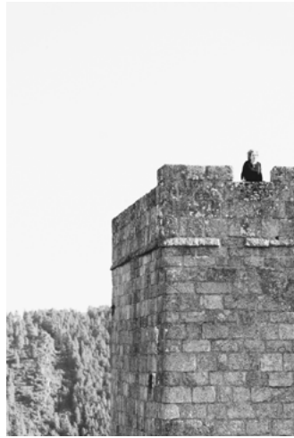
C Torre de Homenaxe e Patio de Armas