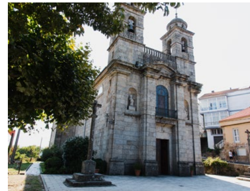
PÁXINA OPOSTA, ARRIBA Igrexa de Santa Isabel PÁXINA OPOSTA, ABAIXO Vista do cemiterio ARRIBA Pensión rústica - restaurante Caldelas Sacra ABAIXO Santuario dos Remedios

Mosquera, que, por medio dunha longa chave e a forza dunha parella de bois, apertaba as porcas que vemos no exterior. O santuario ten unha das escasas cúpulas elípticas de Galicia. Dende o seu adro sae en procesión o fachón grande durante a véspera da festividade de San Sebastián, o 19 de xaneiro. Trátase dun facho acendido duns 30 metros, erguido con forcas polos homes do pobo, que segue á imaxe do santo que percorre a vila. Esta celebración cristiá da Festa dos Fachós presenta reminiscencias ancestrais de culto ao lume.