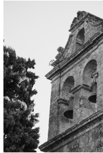
D Igreja de Santa Isabel