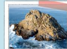
PUNTA DO CENTOLO

A antiga escola, acolle agora unha exposición sobre a historia e costumes dos habitantes de Ons. Consultar horarios en información.