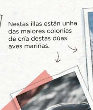
Polo de corvo mariño cristado

Nestas illas están unha das maiores colonias de cría destas dúas aves mariñas.