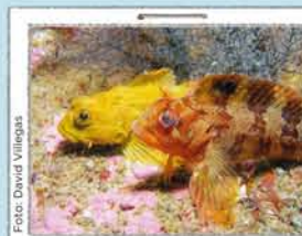
PRAIAS E AUGAS

Nas rochas próximas ás praias vese grande variedade de vida mariña. Gózaa sen tocala cunhas gafas de mergullo. Para usar cinto de chumbos precísase permiso.