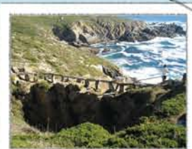
BURACO DO INFERNO

Greta no cantil que mira de fronte aos temporais mareiros do sur, que a ensancharon e profundaron ata afundir o seu teito, creando unha galería entre o ceo e o mar.