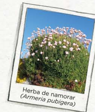
Herba de namorar ( Armeria pubigera )

AS BEIRAS DO CANTIL , na costa máis exposta, onde o mar golpea as rochas. Chssss...! hai unha gardería de aves mariñas.