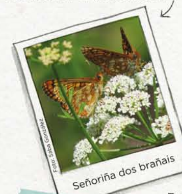
Señoriña dos brañais

Euphydryas aurinia . É unha bolboreta protexida en Europa pois está a desaparecer en moitos sitios.