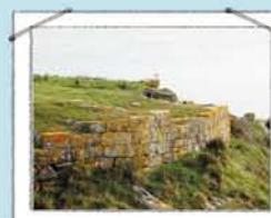
PUNTA DO CASTELO

Miradoiro bordeado coas ruínas dunha fortificación defensiva do s.XIX.