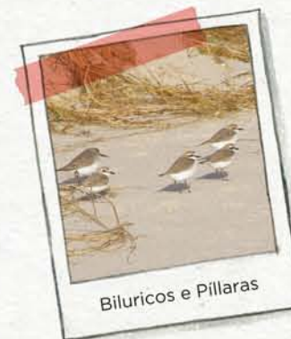
Biluricos e Pillaras

AS PRAIAS atópanse na costa máis tranquila, onde o mar deposita as areas. Estas areas son retidas polas prantas da duna, evitando así a erosión da praia.