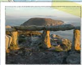
MIRADOIRO DE FEDORENTOS

Ofréceche unha boa vista da illa de Onza, das illas Cíes e da ría de Pontevedra. No verán as crías de gaivota teñen no cantil a súa gardería, polo que para non molestalas non saias do mirador nin as alimentos.