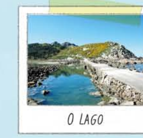
PRAIAS E AUGAS

Nas rochas próximas ás praias vese gran variedade de vida mariña. Descúbrea coa axuda dunhas gafas de mergullo (sen tocala nin alimentala). Para usar cinto de chumbos precisase permiso.