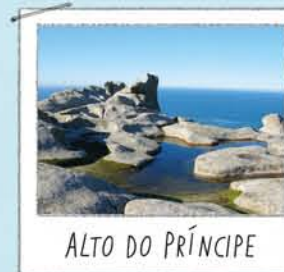
ALTO DO PRÍNCIPE

Unha rocha furada polo vento e o sal. Subirse está prohibido por molestias ás aves. Dende o observatorio próximo gózase de bonitas vistas do lago e dos cantís.