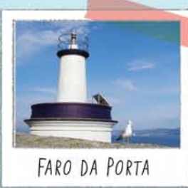
FARO DA PORTA

Enfrontado á illa Sur, da que nos agasalla unha das súas mellores panorámicas.