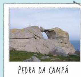
PEDRA DA CAMPÁ

Situado no punto máis alto visitable. Bo sitio onde contemplar os cantís e o voo das gaivotas que alí crían. Para non alteralas non te achegues nin alimentes ás aves.