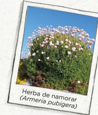
Herba de namorar (Armeria pubigera)

AS BEIRAS DO CANTIL , na costa máis exposta, onde o mar golpea as rochas. Chsssss...! hai unha gardería de aves mariñas.