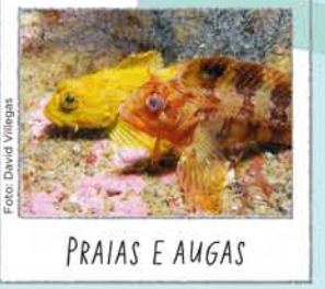
PRAIAS E AUGAS

Un remanso no océano, un refuxio para a vida mariña. Paseando polo seu dique pódense ver distintos peixes. Para non alterar os seus costumes non debes alimentalos nin bañarte no lago.