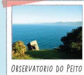
OBSERVATORIO DO PEITO

Un balcón de rocha onde contemplar o lago e os cantís. No verán as crías de gaivota teñen aquí a súa gardería, polo que para non molestalas, non entres na zona de reserva indicada nin as alimentes.