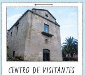
CENTRO DE VISITANTES

Enfrontado á illa Sur, da que nos agasalla unha das súas mellores panorámicas.