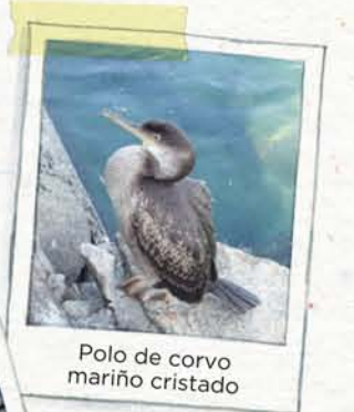
Polo de corvo mariño cristado

Nestas illas están unha das maiores colonias de cría destas dúas aves mariñas.