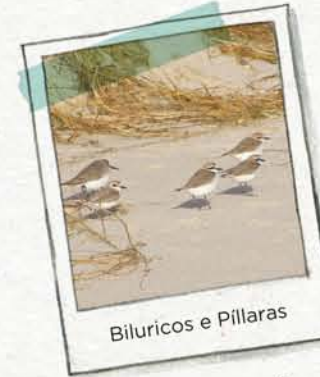
Biluricos e Pillaras

AS PRAIAS atópanse na costa máis tranquila, onde o mar deposita as areas. Estas areas son retidas polas plantas da duna, evitando así a erosión da praia.