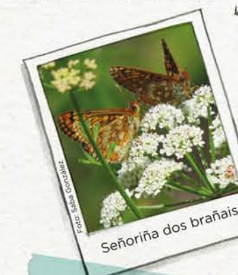
Señoriña dos brañais

Euphydryas aurinia . É unha bolboreta protexida en Europa pois está a desaparecer en moitos sitios.