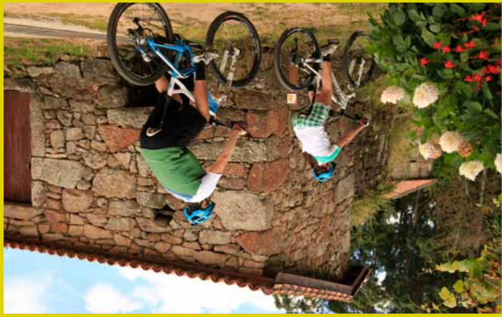
Muros en Arcos