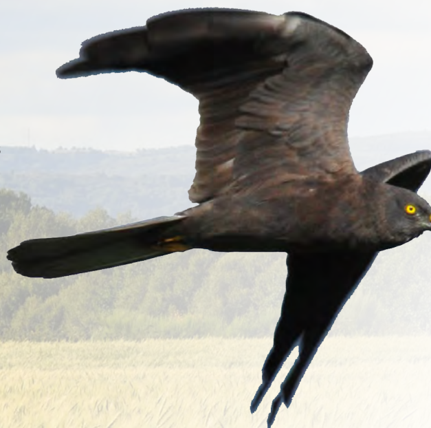
● Tartaraña cincenta

É sorprendente a variedade de aves que podemos atopar nesta zona agrícola: case 250 especies. Salientan as poboacións de pasallás comúns, cegoñas brancas, sisóns dos nabos, calandriñas comúns, tartarañas cincentas ou gatafornelas. Entre as aves acuáticas, ou ligadas a medios fluviaís, atopamos avefrías comúns e diferentes tipos de garzas, como a pequena, a vermella ou a da noite. A primavera é quizais o mellor momento na Limia, cando multitude de aves ocupan zonas húmidas, cultivos e bosquetes. No inverno son de grande interese as areeiras, onde habemos avistar diferentes aves acuáticas que teñen aquí o seu refuxio.