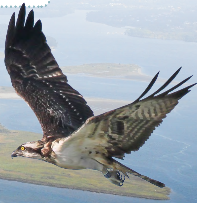
● Aguia pescadora