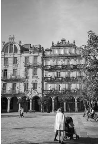
B Praza da Ferrería e igrexa de San Francisco