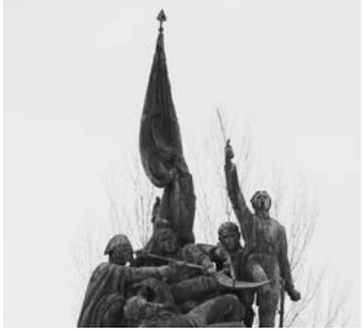
A Alameda y ruinas del convento de San Domingos