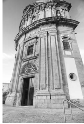
C Santuario de la Virgen Peregrina