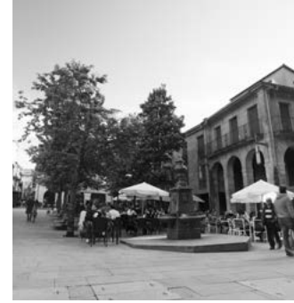
D Praza da Leña, praza da Verdura