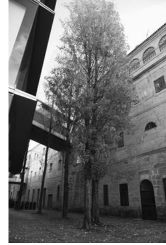
E Museo provincial de Pontevedra