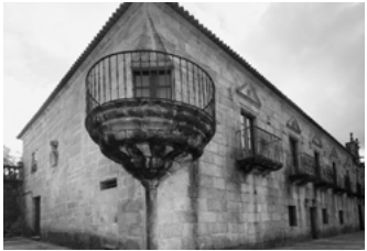
A Pazo de Fefiñáns