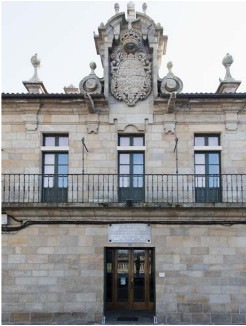
ARRIBA Pazo de Montesacro

la ría de Arousa. Muchos e importantes fueron los personajes históricos que ocuparon las dependencias de esta fortificación, entre ellos la reina consorte Juana de Castro, que, según cuenta la leyenda, fue encarcelada por su esposo el Pedro I, llamado el Cruel, la misma noche de bodas.