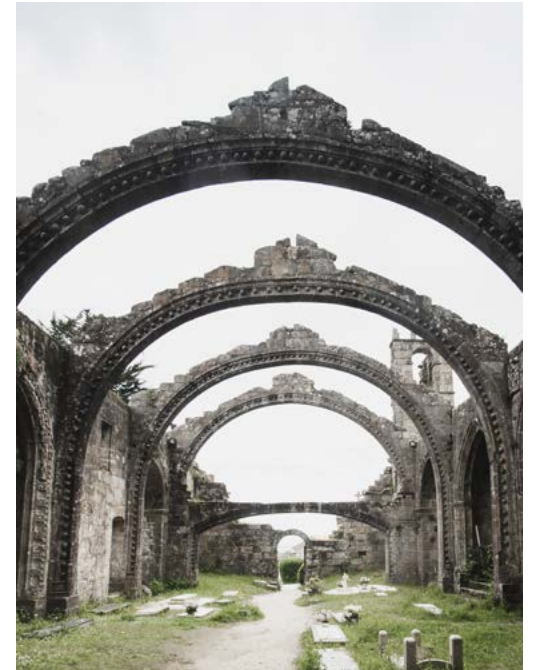
ARRIBA Ruinas de Santa Mariña Dozo

Detrás de las ruinas está el MONTE DA PASTORA , donde podemos disfrutar de las mejores vistas de Cambados, sus viñedos y su mar, la ría de Arousa. En este lugar, el 5 de agosto, se celebra la romería de San Xusto y San Pastor,