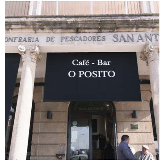
ARRIBA Café-bar O Pósito ABAJO Plaza de Abastos

poco más adelante descubrimos la estatua Rañeiro, de Alfonso Vilar, que se encuentra más adelante, representa una instantánea del trabajo diario de los mariscadores de esta ría.