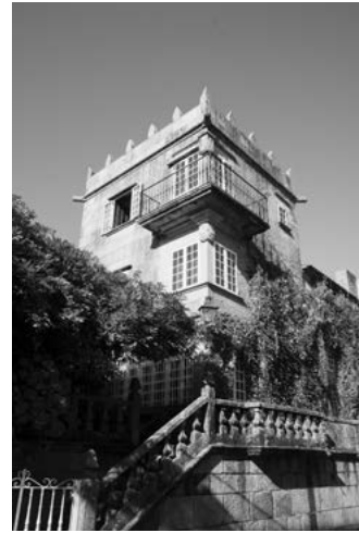
D Pazo de Fajardo