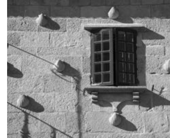
E Casa das Cunchas