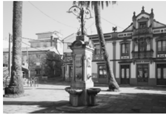
C Praza de Alfredo Brañas