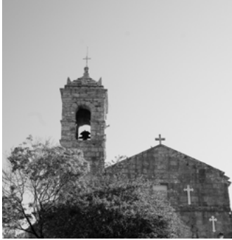
B Iglesia de San Francisco